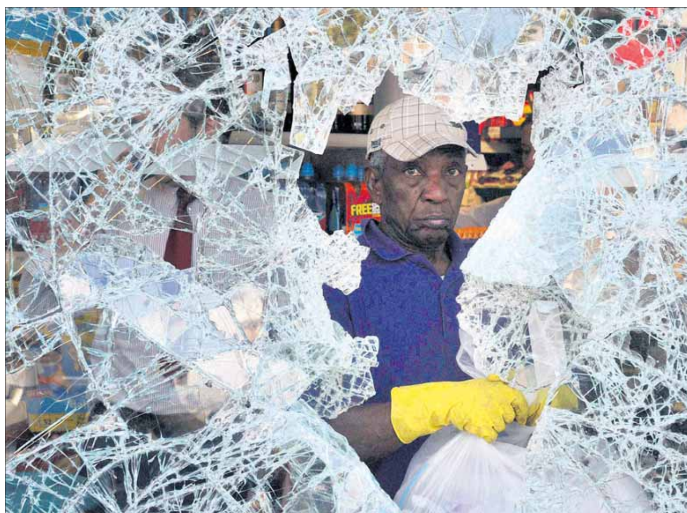
„Die Ausgrenzung einzelner Schichten ist auch bei uns ein Thema“, schreibt ein Leser.

Die Randalierer in Großbritannien haben die Hoffnung auf Veränderung aufgegeben – Reaktionen zu den Unruhen