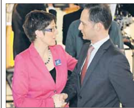
Annegret Kramp-Karrenbauer und Heiko Maas nach der Saarland-Wahl.