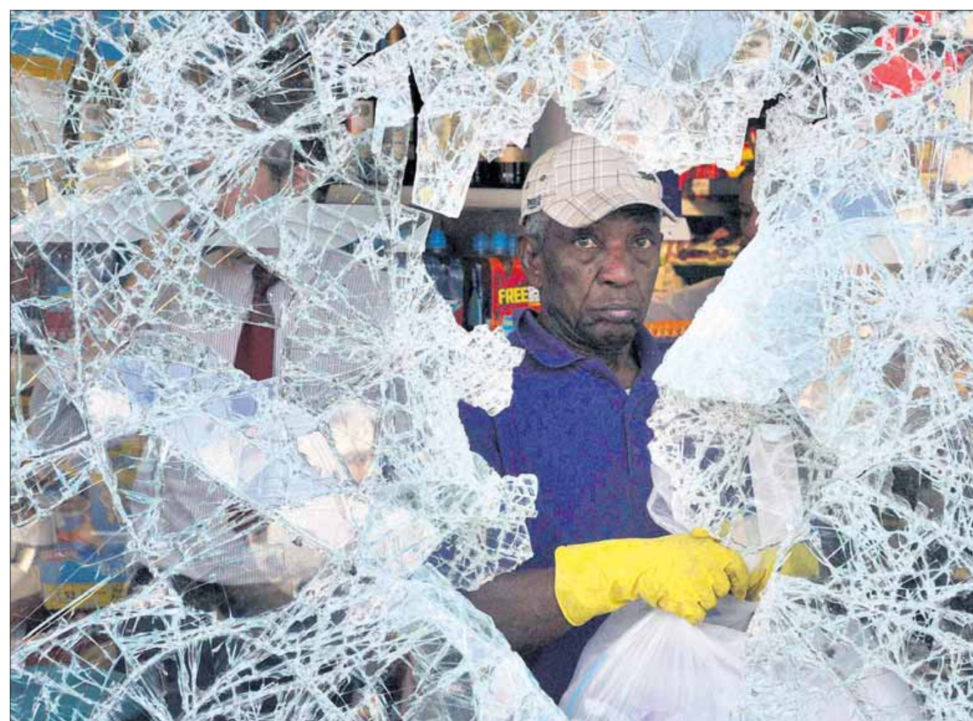
„Die Ausgrenzung einzelner Schichten ist auch bei uns ein Thema“, schreibt ein Leser.

Die Randalierer in Großbritannien haben die Hoffnung auf Veränderung aufgegeben – Reaktionen zu den Unruhen